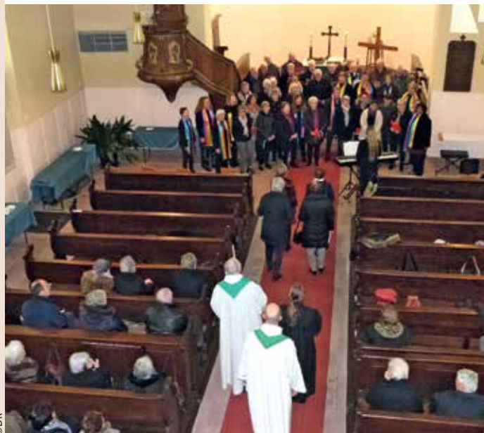
Célébration œcuménique 2023 avec la participation de trois chorales.

Dans notre secteur, la célébration aura lieu en cette année 2024 à l'église catholique de Soultz-sous-Forêts , le dimanche 21 janvier à 10h . Elle sera animée musicalement par les chorales de Memmelshoffen, de Merkwiller-Pechelbronn et de Soultz-sous-Forêts.