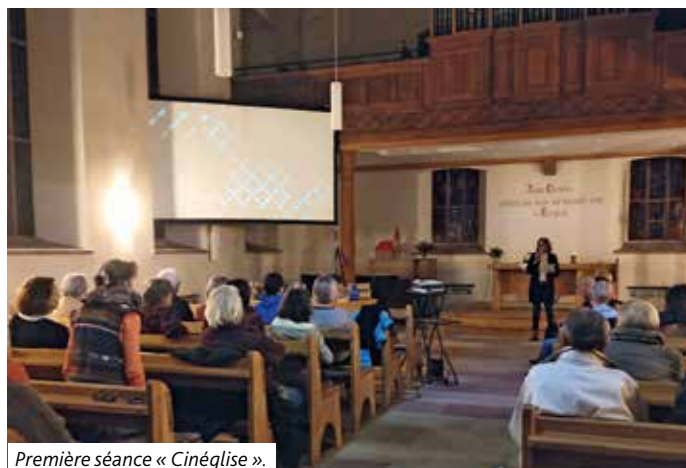
Première séance « Cinéglise ».

La projection du Film « La chorale du Bonheur » le vendredi 3 novembre à 19h30 à l'église de Seebach a rassemblé un public varié et de tout âge. À travers ce film, le réalisateur Kay Pollak nous a partagé sa vision sur l'existence en nous parlant du pouvoir magique de l'art, de la force de l'amour, de libération. La musique est en nous, il suffit d'écouter son cœur. Prenez du temps pour tout ce que vous aimez ! Partagez la musique de l'âme, de la confiance, de la solitude, de l'amour et de l'espoir, de la joie et du chagrin. C'est la musique des cœurs, celle que chantent les anges du ciel.