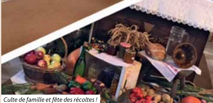
Culte de famille et fête des récoltes !