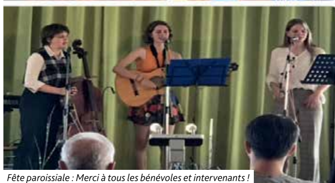
Fête paroissiale : Merci à tous les bénévoles et intervenants !